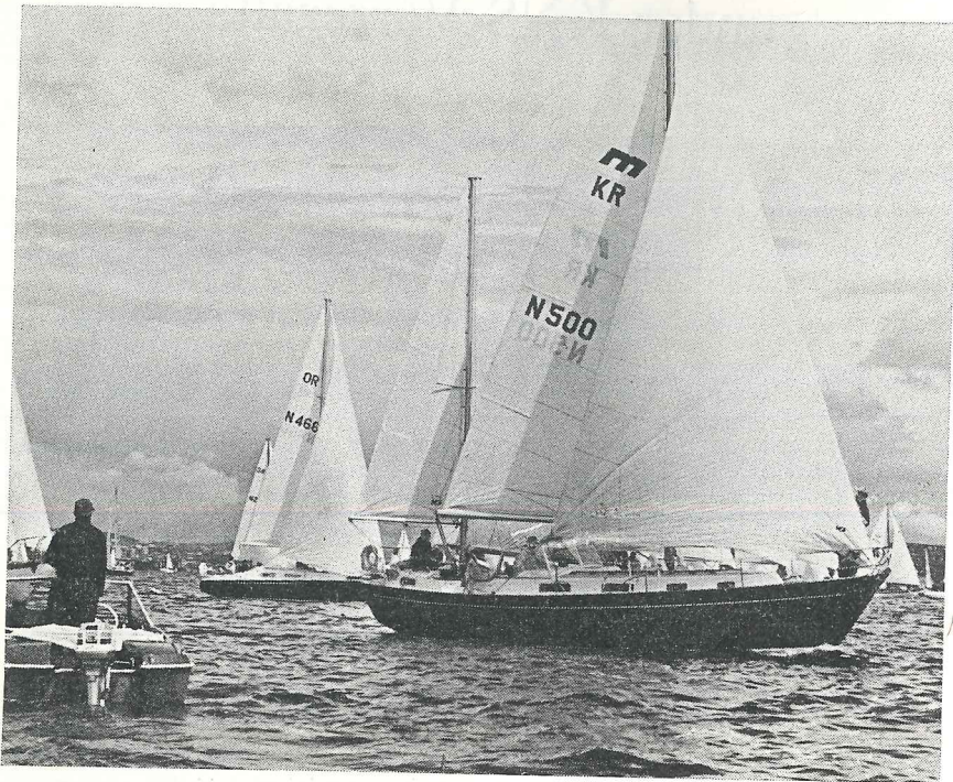
Fra starten utenfor Geita.

Deltager-rekordene faller raskt når det gjelder Færderseilasen, over 300 båter anmeldt denne gangen! Et mareritt for danskebåten i Drøbaksundet, som blåste panisk med fløyta, men til stor glede ellers. En masseoppvisning og et budskap om hvor seil-sporten er i vekst. Muren av spinnakere i alle regnbuens farver i sundet ved Digerud, pakket tett fra strand til strand, var et syn man vel aldri har sett maken til i fjorden.