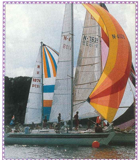
Fra målgangen Horten

L ørdag morgen, i den friske nordavinden, slet rundingsbøyen utenfor Åsgårdstrand seg og drev inn på grunt vann der den ble hengende i loddet. Forståelig nok var det mange som pliktskyldig seilte helt inn og forsøkte å runde bøye. Resultatet var grunnstøting og mye irritasjon. Da regattakontoret ble varslet gikk en båt straks til stedet og fikk lagt ut bøya med skikkelig ankerfeste. Episoden minner om noe tilsvaren-