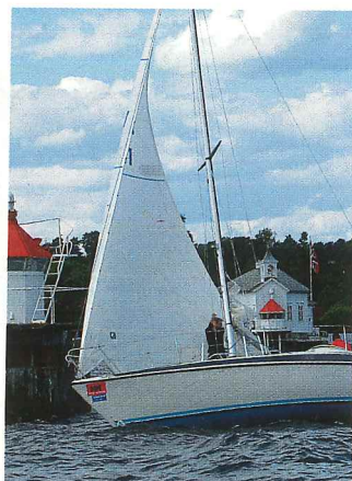
Maxi'en «Mahja II» var uheldig og gikk på grunn rett etter start.