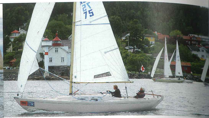
«Lychen II», raskeste IF til Filtvedt og i mål.