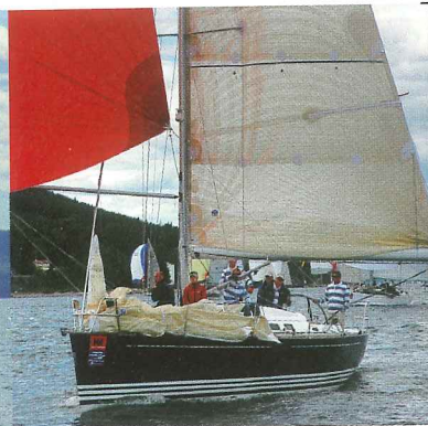
«Breezin», beste LYS R40.