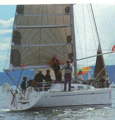
«New Deal», beste LYS R33.