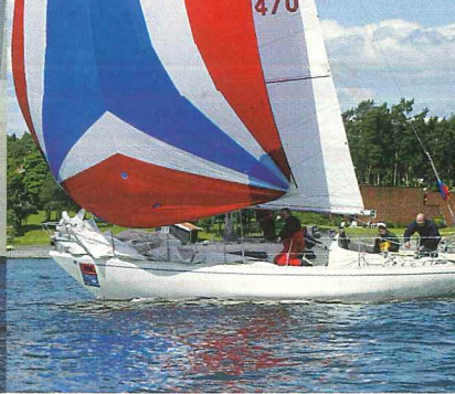
«Odyssevs» gikk til topps i LYS 1,15-1,16.