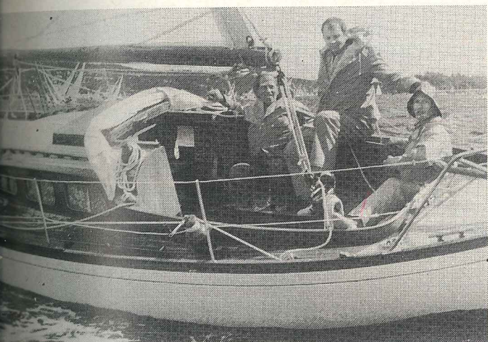
«Second Love» med K. Sømme til rors hørte til de mange eldre båtene som var med, og vant gjorde den i Scandicap langkjølt klasse 3.