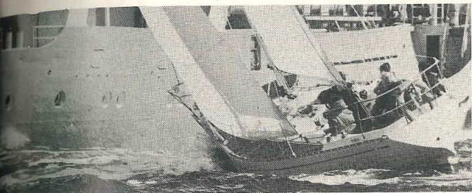
Noe problemer med nyttetraffikken oppstod, etter hva Seilas har erfart, ikke i årets seilas, selv om dette ser ganske skummelt ut.